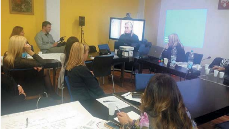
Радна атмосфера са обуке у Новом Саду на којој се анализирају претходно снимљени јавни наступи

вас на то не може натерати. Немојте дозволити да незгодна питања буду разлог прекида комуникације са новинарима.