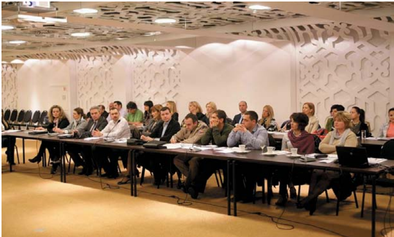
Тужиоци и новинари заједно на радионици, отворено о сарадњи и изградњи партнерског односа

За добру комуникацију институције са странкама и јавношћу, претпоставка је добра унутрашња комуникација која се остварује првенствено у оквиру једног јавног тужилаштва, али и између тужилаштава различитих инстанци. Циљ интерне комуникације је да сви запослени у тужилаштву буду упознати са свим новинама, начином рада и проблемима са којима се сусреће тужилаштво. Као начини за унутрашње – интерне комуникације могу се навести састанци са запосленима и састанци – колегијуми заменика јавних тужилаца где се размењују информације, али и искуства из ове области и указује на штетност цурења информација. Циљ интерног ПР-а јесте сталан и ефикасан проток разумљивих и мотивишућих информација између запослених у оквиру једног јавног тужилаштва, али и између јавног тужилаштва као целине.