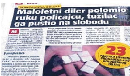
Примери новинских чланака