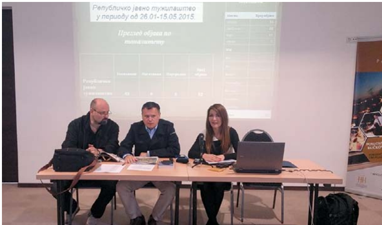
Представљање резултата примене Комуникационе стратегије – анализа резултата

Кризни ПР тим је тим који управља кризном ситуацијом, дефинише стратегију, одређује тактику и начине комуницирања са медијима како би се криза замрзла, а уколико је могуће, да се криза искористи и као прилика да се стекну позитивни поени, па чак