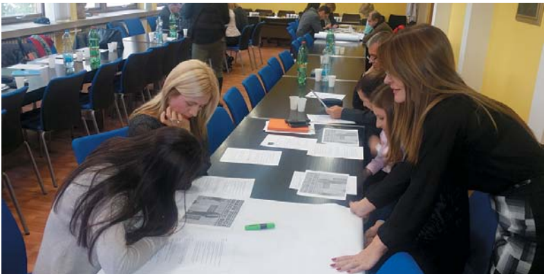
Координатор за спровођење Комуникационе стратегије у анализи текстова са особама овлашћеним за односе са медијима

Из досадашње праксе је утврђено колико је значајна анализа медијских садржаја како би могло правовремено да се реагује или спречи негативно представљање рада тужилаштва. С тим у вези је уочена и потреба за додатном обуком особа задужених за односе са медијима и ПР тимова на ову тему како би се оснажило адекватно превентивно и реактивно медијско деловање, али и деловање у области промовисања рада.