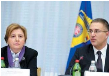
Загорка Доловац, републички јавни тужилац, и Небојша Стефановић, министар унутрашњих послова Републике Србије

„...Републички јавни тужилац Загорка Доловац изјавила је да је неопходна сарадња јавног тужилаштва и полиције како би се брзо реаговало и омогућило прикупљање квалитетних доказа у случајевима насиља у породици и да нам је циљ правноснажна осуђујућа пресуда, као и да пред насиљем ниједан део друштва не сме да затвори очи, као и да то