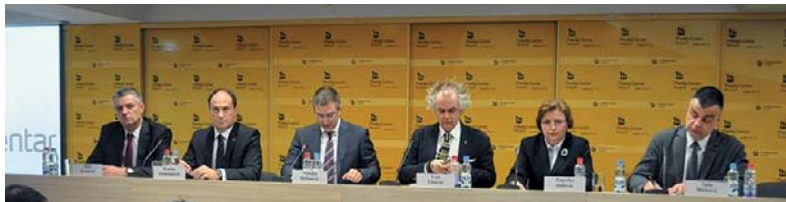
Конференција за новинаре посвећена борби против сајбер криминала