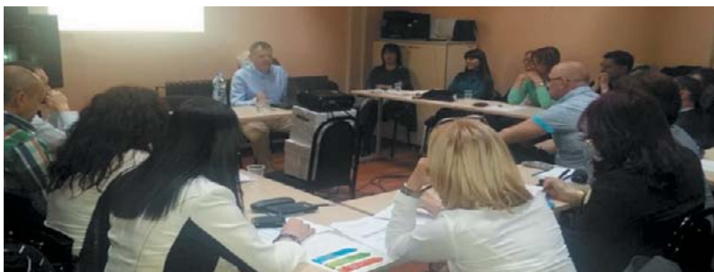
Обука за писање комуникационих протокола. Апелационо јавно тужилаштво Крагујевац, априла 2015. године

Од обучености особе која спроводи, планира активности и планира информације зависи и степен примене Комуникационе стратегије тј. правилна комуникација, с обзиром на то да је реч о специфичној области у којој је потребно посебно искуство и знање за поступање.