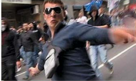
Тужилац на сценарију B92 допринио се кривим протеклом (члук) наредне недеље ујачујеника Радољана Караџића у јулу 2005. (јидење и Дојче)